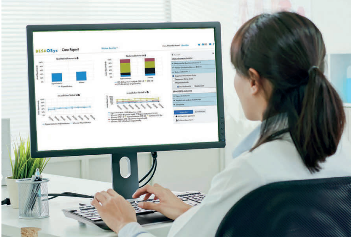
Das Dashboard «Care Report»: Eine visuelle Darstellung der Indikatordaten unterstützt Heime bei deren Analyse.