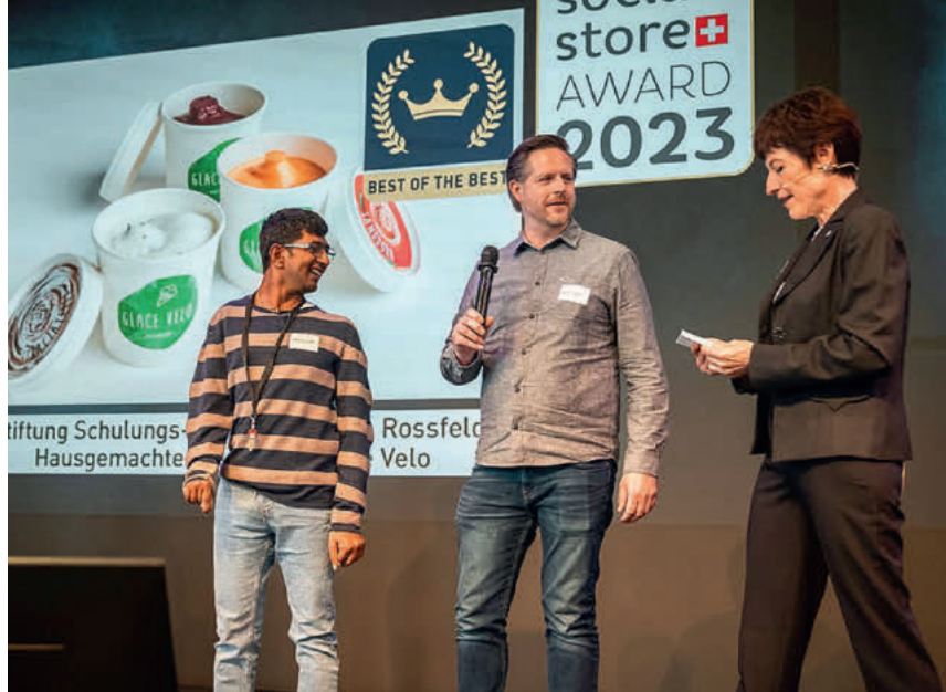
Szene an der Preisverleihung vom letzten Jahr.