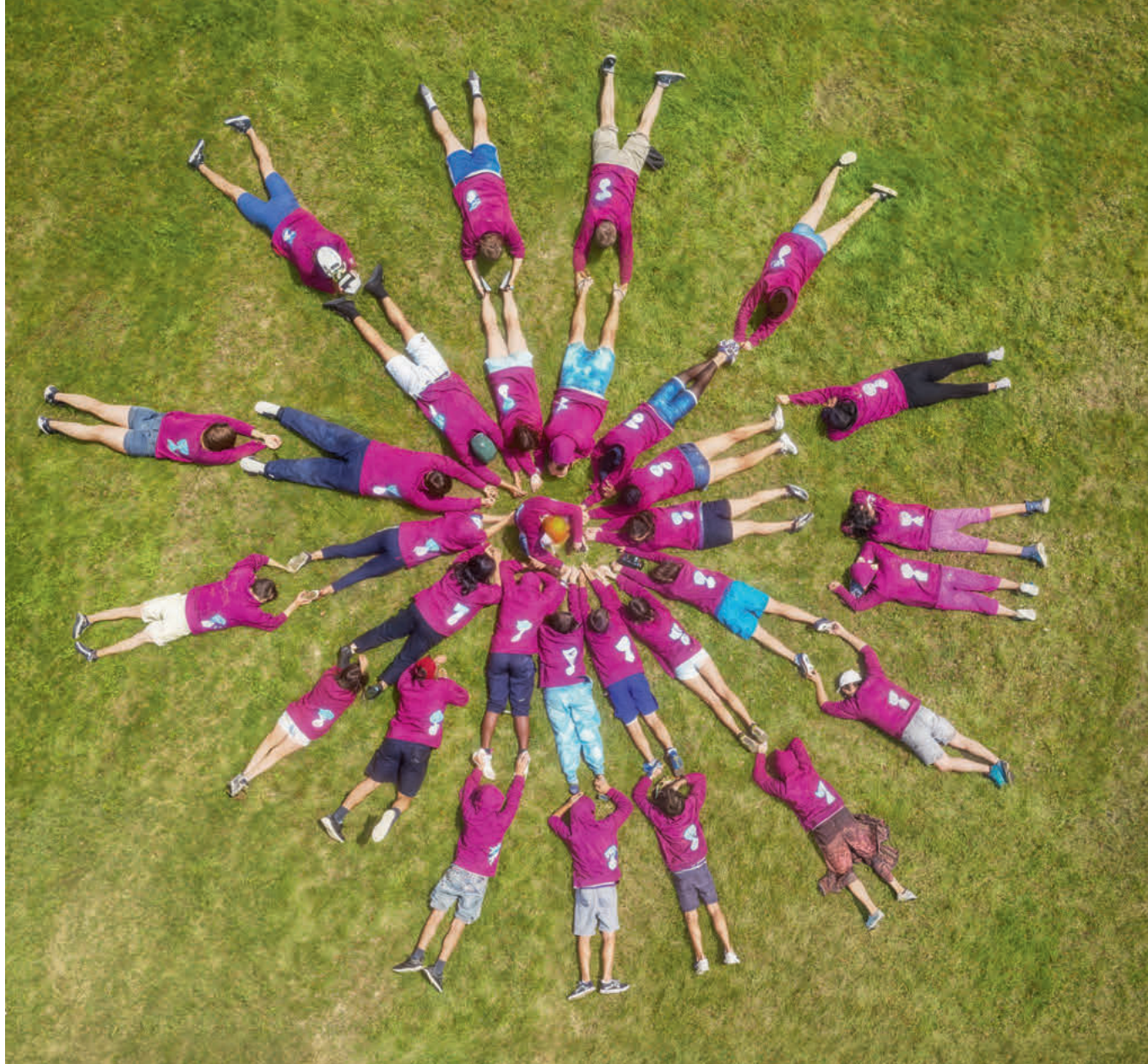
Jugendliche mit und ohne Behinderung in einem Sommerlager des Vereins Atgabbes.