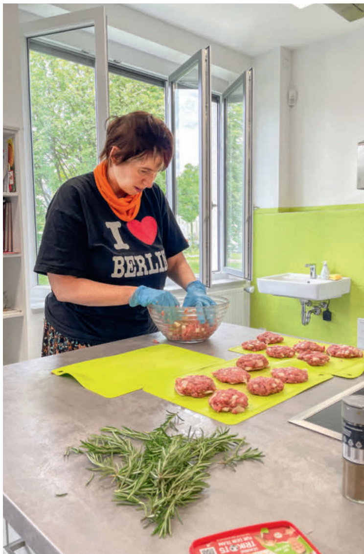
Eine Teilnehmerin der Kochgruppe bei der Zubereitung von Frikadellen.

entstanden sind, zurückerhalten sollen», erklärt Heike Winkler. Die Aufwendungen reichen von der Rückvergütung eines Fahrscheins bis zu einer Tagespauschale für Reisebegleiter.