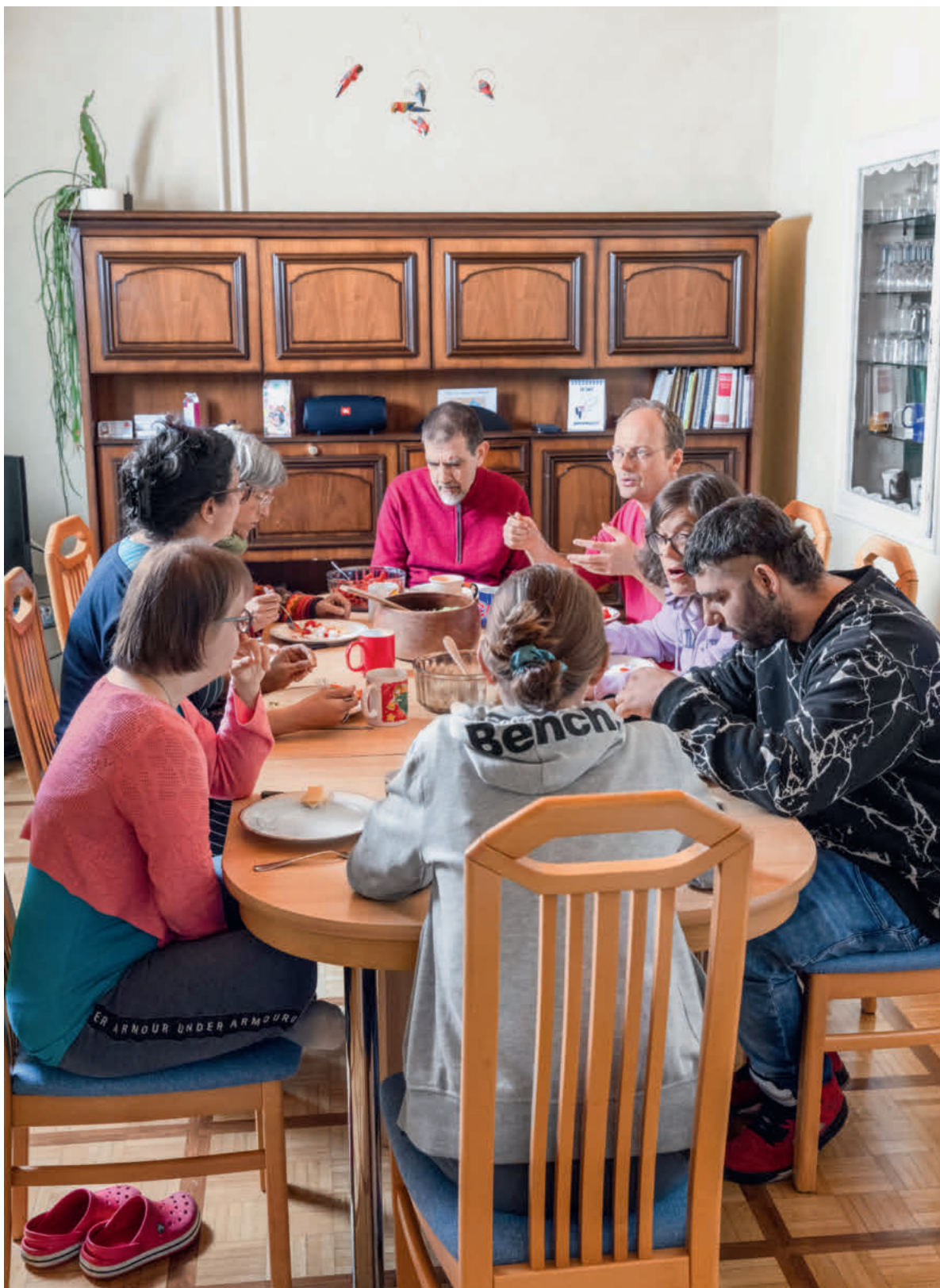
Zum Abendessen treffen sich alle WG-Mitglieder, um sich über den Tag auszutauschen.