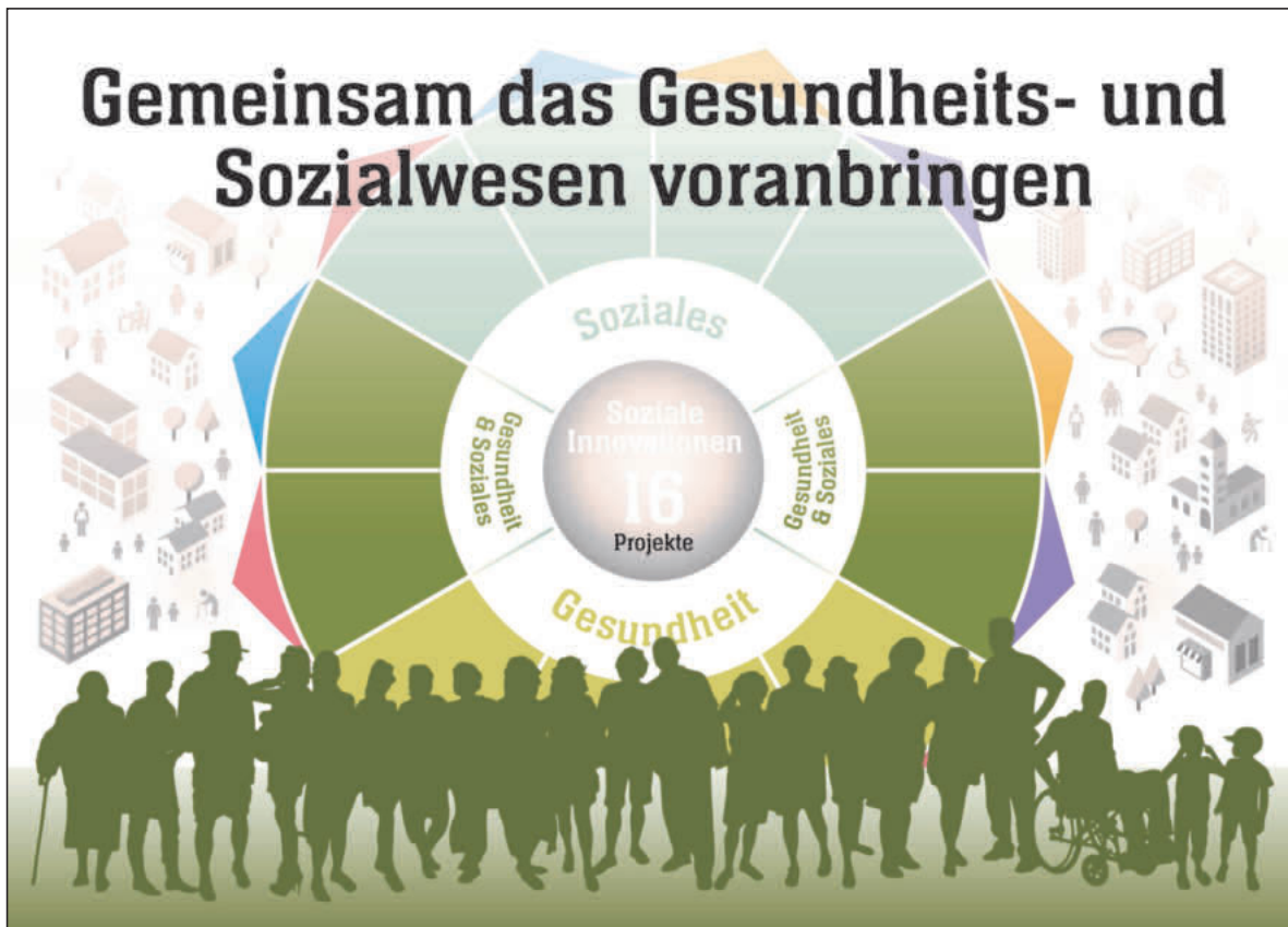
Standbild zur interaktiven Übersicht mit Menschen im Vordergrund. Die Karte zeigt, in welchem der drei Bereiche Soziales, Gesundheit sowie Gesundheit & Soziales eine Idee ansetzt.